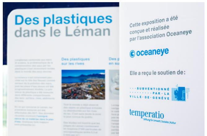
L'exposition selon différents points de vue. Les trois panneaux recto-verso sont indépendants et peuvent être disposés selon les envies dans l'espace de visite.

association oceaneye / 1200 genève +41 78 637 16 73 / info@oceaneye.ch www.oceaneye.ch