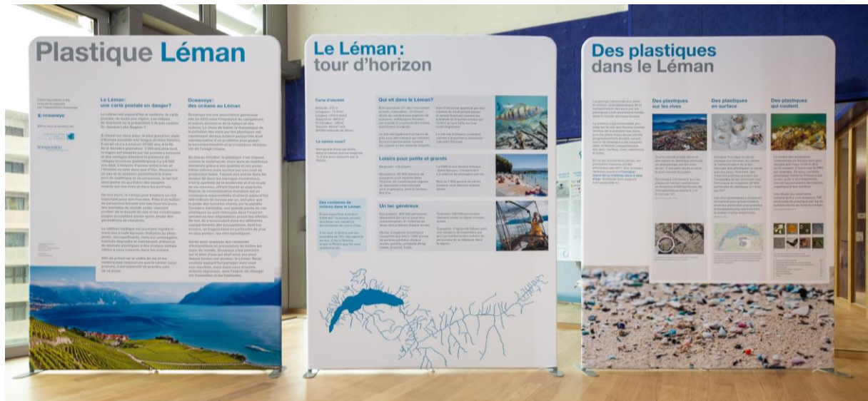
Vue de face des panneaux 1 à 3