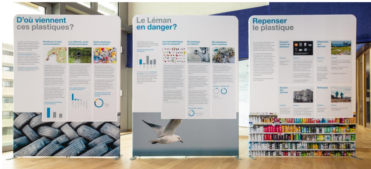
Vue de face des panneaux 4 à 6