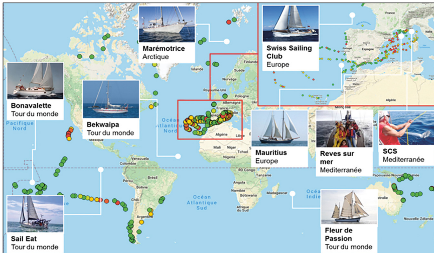
Voiliers bénévoles participants au projet d'Oceaneye en 2017

Une cartographie interactive via notre site web a été mise en place. Les données peuvent être affichées par voilier bénévole, ce qui permet de valoriser la contribution de chaque partenaire.